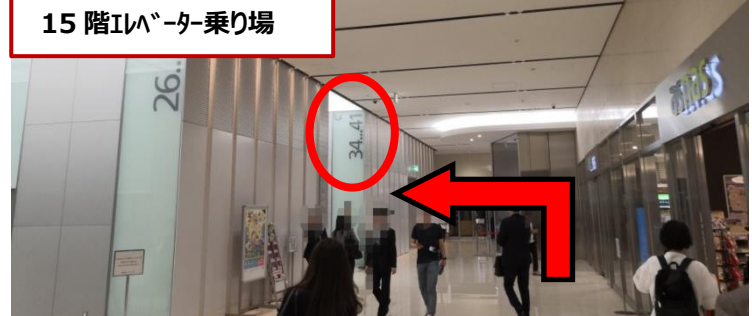
15 階エレベーター乗り場

15 階エレベーターを降りて直進すると、左手に A・B・C3 種類のエレベーター乗り場があります。一番奥の C(34~41 階)にお乗りいただき、34 階までお越しください。