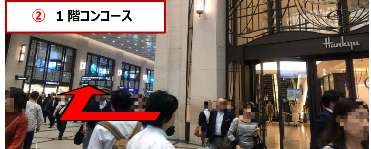
② 1 階コンコース

阪急百貨店の入口を右手に阪急グランドビル(32 番街)を左手に見ながら突き当りのエスカレーター手前を左手に曲がります。