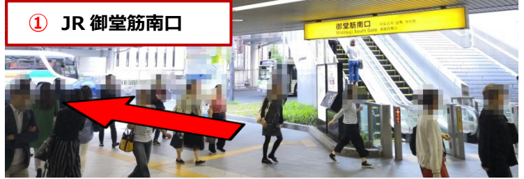
① JR 御堂筋南口